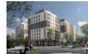
2 UN ENSEMBLE D'HABITATIONS ET DE COMMERCES, AUTOUR DU CASINO RÉNOVÉ