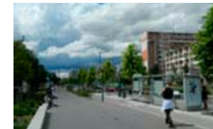
1 UNE AVENUE ADOUCIE, OÙ CHAQUE MOYEN DE TRANSPORT A SA PLACE. HORIZON 2019, LE TRAM T6 RELIERA DEBOURG AUX HÔPITAUX-EST VIA L'AVENUE MERMOZ.