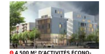
4 4 500 M 2 D'ACTIVITÉS ÉCONOMIQUES ET COMMERCIALES LE LONG DE L'AVENUE MERMOZ 5 EXTENSION DES GALERIES LAFAYETTE ET CRÉATION D'UN PARKING RELAIS