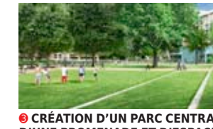
3 CRÉATION D'UN PARC CENTRAL, D'UNE PROMENADE ET D'ESPACES PUBLICS REQUALIFIÉS 25 000 m 2 d'espaces extérieurs (70 % d'espaces publics)